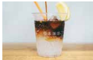
Coffee lemon tonic 珈琲レモントニック