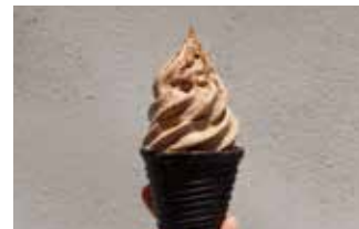
Home Roasted Coffee Soft Serve