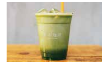
Matcha latte 抹茶ラテ