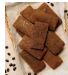
Osaka coffee financier