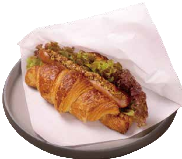
クロワッサンドッグ