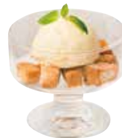
寄本の バニラアイスラスク

⚠️ 蜂蜜は1歳未満のお子様には与えないでください。ご希望によりメールシロップに変更頂きます。