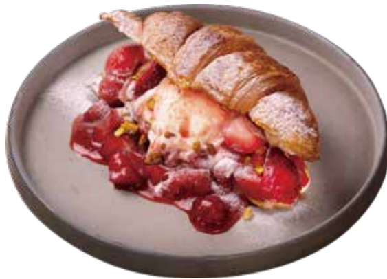
ブリュレクロワッサン ストロベリー

サクッと香ばしく焼き上げたブリュレクロワッサンに、 ひんやりとしたアイスとクリームをたっぷりサンドしました。