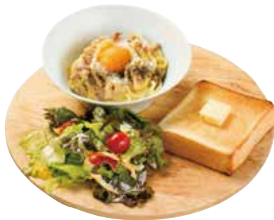
パスタプレート 濃厚カルボナーラ