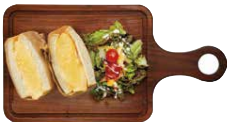
厚焼きたまごの極美サンドイッチ