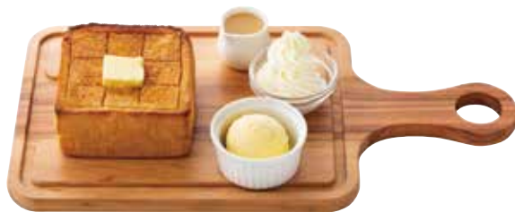
極美ハニートースト プレーン