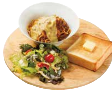
パスタプレート シェフ特製ミートソース

クリームソースと卵黄が絡み合う濃厚な味わいのカルボナーラです。 グラナパダーノチーズとベーコンの塩気がアクセントに。