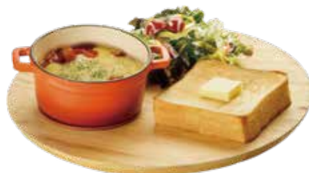
とろけるチーズの トマト煮込みハンバーグ

コク深く豊かな味わいの デミグラスソースに 仕上げました。 余ったソースをパンに浸して お召し上がりください。