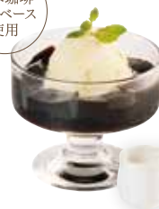
寄本珈琲の コーヒーゼリー