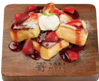
フレンチトースト ストロベリー