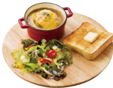
スーププレート オニオン グラタンスープ

お肉たっぷりの特製ミートソースと、 4種のチーズクリームソースを絡めて味わうシェフこだわりの逸品。