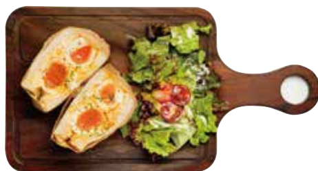
半熟たまごの極美サンドイッチ

こだわりの卵で丁寧に作ったなめらかな舌触りの厚焼き玉子を豪快にサンドしました。甘酸っぱいレモンジャムをアクセントに使用しています。