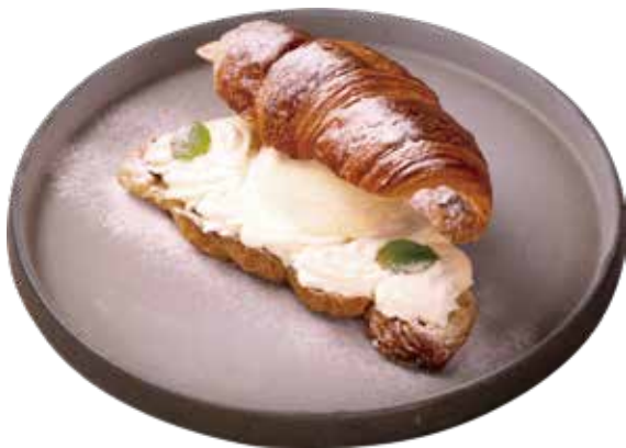
ブリュレクロワッサン プレーン