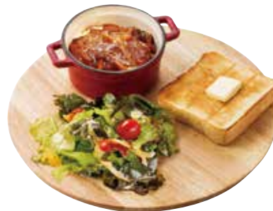
煮込みデミグラス ハンバーグ

芯まで柔らかくした 玉ねぎをまるごと使った、 素材の旨味を出した4種の チーズがとろける グラタン風スープです。