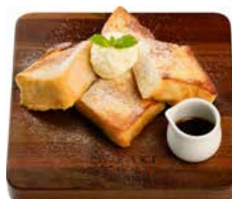
フレンチトースト プレーン